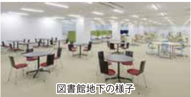
図書館地下の様子

ロアが利用可能となり、地下には個人だけでなく、グループ学習にも対応できる自習スペースが新設されました。電子黒板などの機器も導入され、