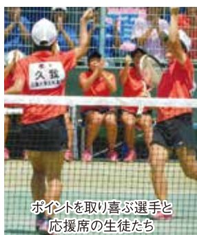
ポイントを取り喜ぶ選手と応援席の生徒たち

個人戦では2ペアが4回戦まで駒を進めましたが上位進出はなりませんでしたが、団体戦は第7シードのため2回戦からの出場で、初戦は北越高（新潟県）との対戦となりました。ポイントを取り合い3番勝負に持ち込むものの最後は力尽き、1-2で負けてしまいました。優勝という目標には届きませんでした。