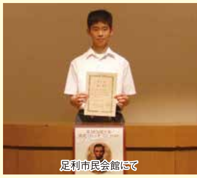
足利市民会館にて

この結果を受けて11月16日から8 日間、足利市からの訪米団の員 としてアメリカ合衆国スプリング