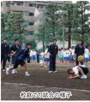
校庭での試合の様子