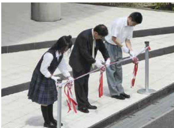
▲富can祭テープカットの様子