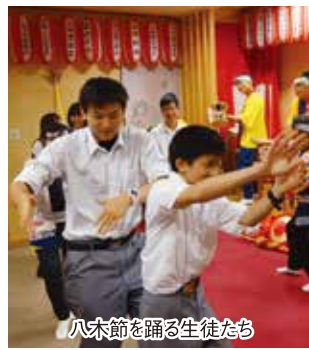
八木節を踊る生徒たち