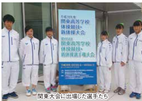
関東大会に出場した選手たち

人で1名が出場し、女子は総合で17位となりました。 関東地区の体操競技は全国的にもレベルが高く、非常に高度な技術が要求される大会でしたが、選手たちは、自分の持っている力を十分に発揮して演技をすることが出来ました。