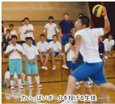
カッパいボールを投げる生徒

足利三名所である日本遺産で日本最古の学校「史跡足利学校」、国宝に指定された本堂のある「鏝