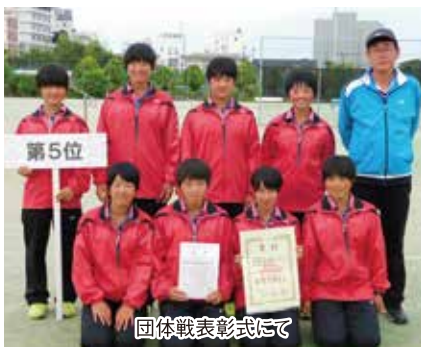
団体戦表彰式にて