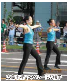
広島市街でのパレードの様子

バントワリントン部は第40回全国高等学校総合文化祭（ひろしま総文）に出場しました。7月30日、戦時中原爆が投下された広島市にある「広島平和記念公園」での出発式では、平和への願いを込めた