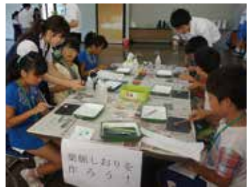
葉脈しおりを作ろう

8月10日に足利市織姫公民館で、SSH生涯学習講座の一環として「白鷗理科教室」が開催されました。昨年度は、足利高校と共催での「オーブン理科教室」でしたが、本年度は、白鷗足利中学校との共催となりました。高校からは、「逆○×ゲーム」、「化石のレブリカをつくらう」、「色が変わる魔法の筆」、「葉脈しおりを作ろう」、「浮沈子をつくらう」、「シャボン玉の中に入ろう」の6実験、中学校からは、「ラクトアイスをつくらう」、「スライムづ