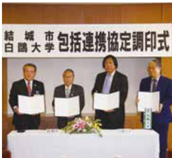
結城市での調印式

これまでにも「ふれあい出前講座 白鷺大学編」や各種委員の委嘱などが行われてきました。今後は、包括的に連携することで、より内容を充実させていく予定です。在学生が小中学校の授業や部活動を支援する「スクールサポート事業」をはじめ、在学生と市民らによる「まちづくりワークショップ」の開催、在学生のボランティア活動への参加などを計画しています。