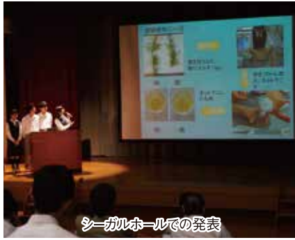
シールホールでの発表

6月17日に、3年生最後のSSH生徒研究発表会が富田校舎のシールホールで開催されました。今回は、宇都宮大学、群馬大学、前橋工科大学の3つの大学で課題研究に取り組んでいた15グループと科学部から1グループが発表し