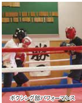
ボクシング部パフォーマンス

8月27日・28日の2日間、中学生を対象に「一日体験学習」が開催されました。両日で生徒・保護者合わせて、本校舎2579名、富田キャンパス1948名、合計4527名という過去最多の参加がありました。