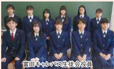
富田キャンパス生徒会役員