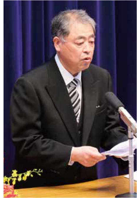
卒業式での学校長式辞▲