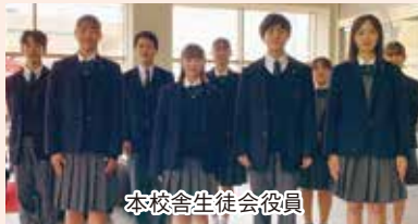
本校舎生徒会役員

11月1日の認証式をもって、生徒会が足りました。新生徒会は本校舎9名、富田キャンパス13名の計22名です。一人ひとりがやる気に満ちており、「学校を今まで以上に良くしよう」と熱い思いを持っていきます。先輩から業務を引き継ぐだけでなく、学校行事の見直しを始めました。