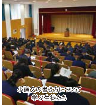
小論文の書き方について学ぶ生徒たち

富田キャンパスでは11月25日に第一学習社主催の「小論文トレーニング」を実施し、SDGsに関する小論文に挑戦しました。自分で調べたSDGsのことや講演を聴講して気づいたことなどを文章にまとめることで、学びを深めることが目的です。