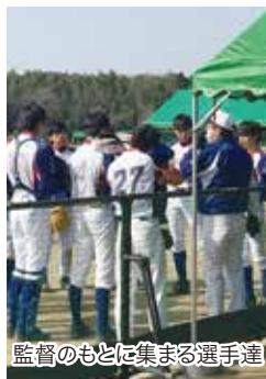
監督のもとに集まる選手達

しいサヨナラ負けとなりました。敗戦とはなりませんが、内容としては悪い試合ではなく、選手たちも皆、清々しい表情を浮かべていました。今大会を反省材料とし、次の大会に向けて頑張ります。今後も応援よろしくお願いします。