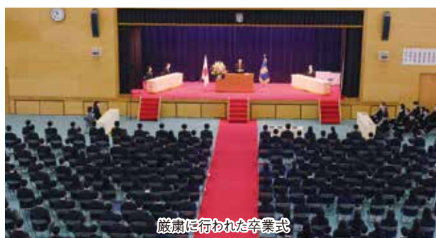
厳粛に行われた卒業式

◆「みんなちがって、みんないい」…大正末期から昭和初期にかきこまれた言葉です。「やるべきことはやって、後は自然の成り行きに任せる」という意味なのです。本来の意味を知ると、少し哲学的といえるのか、宗教的といえるのか、深い意味合いの言葉であることが分かります。