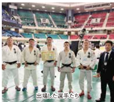
出場した選手たち

続く東海大相模高（神奈川県）には0-3で敗れましたが、第5位入賞と高校総体に向け大きな手応えを感じる大会となりました。