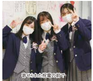
寄せられた祝電の前で

の影響を受け続け、修学旅行 をはじめとする様々な学校行事や 部活動の大会が中止となり、辛い 思いをすることが多い高校生活で もありました。しかしそのような 中でも、3年間水泳部での活動を やり遂げたことは、これからの人 生において大きな自信になりまし た。また、部活動を通じて、仲間 と支え合って目標に向けて前進す ることの大切さを学ぶことができ ました。