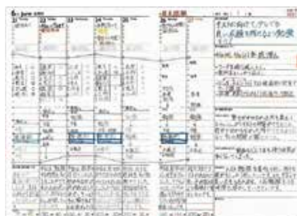
五反田さんの作品

感染症対策の観点からテレビ放送やオンラインを活用しての実施となりました。全体講演は「有意義