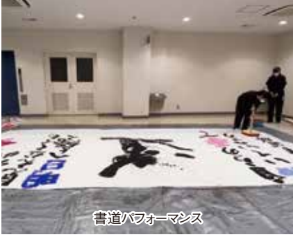
書道パフォーマンス

キャンパスの生徒による「実話をもとにした高校生短編自主映画L E T i t b e」など、個性豊かで大変見応えのあるイベントとなりました。