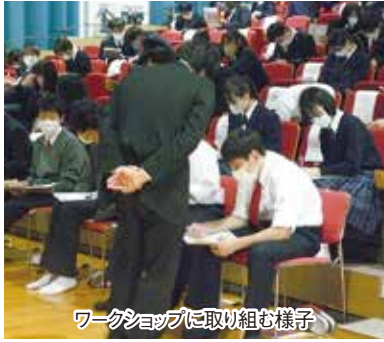
ワークショップに取り組む様子

SDGsとは、2030年までに達成すべき持続可能な開発目標として、17の世界的目標、169の達成基準、232の指標を示し、持続可能な世界を実現しようとする取り組みのことで。この講座では、環境汚染や貧困社会の現実を示した上で、それらを解決するために各国や世界の企業がどんな取り組みを行っているのかという実例を多く取り上げました。