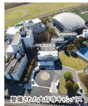
整備された大行寺キャンパス

学女子短期大学の校舎時計塔跡地に設置された時計台は、大行寺キャンパスの新たなシンボルとなりました。また、白鷗大学エンブレムのほかに鷗友会のマスコットキャラクター「おうくん・ゆうちゃん」も描かれた文字盤は、夜間に照明が点灯します。