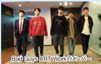
Bad Guys ART Workのメンバー

私たちは、映画を通して自分たちの意見を、高校生である「今」伝えることに意義を感じています。協力してくれた人たちのおかげで多くのメディアにも取りあげられ、私たちの「遊び」は将来の目標や夢に繋がっていきま