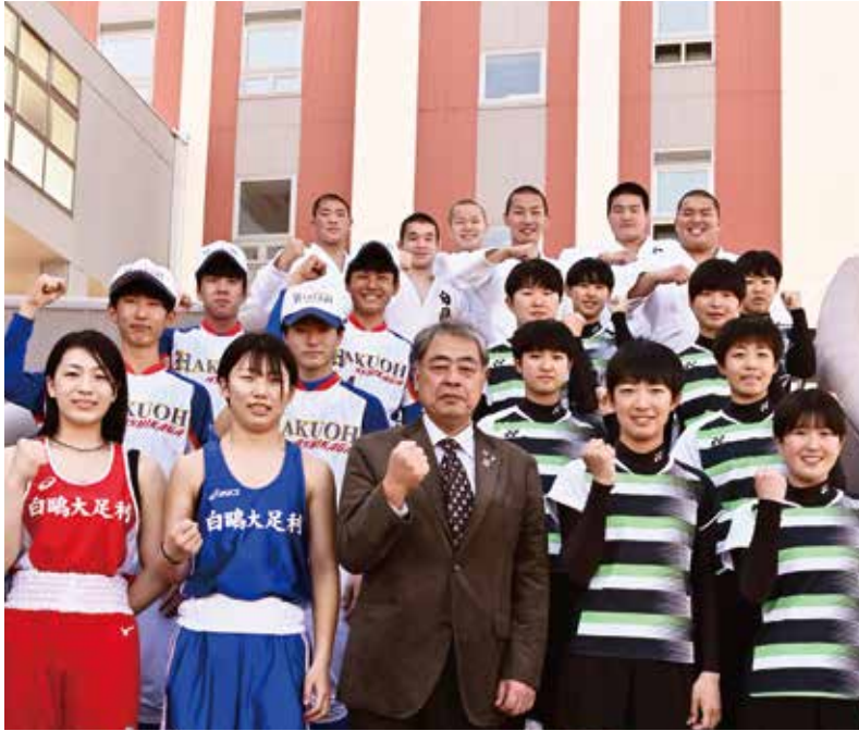
▲全国大会出場を決めた選手たち