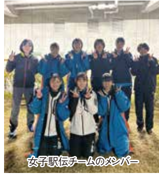
女子駅伝チームのメンバー

11月20日、栃木県宇都宮市カンセキスタジアムにおいて、関東高校駅伝競走大会が行われました。