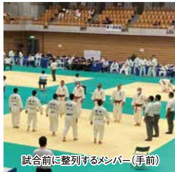
試合前に整列するメンバー(手前)

6月12・13日、山梨県小瀬スポーツ公園武道館において、第69回関東高等学校柔道大会が行われました。本校チームは栃木県予選で準優勝し、栃木県代表として男子団体戦に33回目の出場を果たしました。