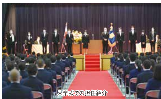
入学式での担任紹介

本校では、この「8つの力」を生徒たちに身につけさせるために様々な取り組みをしています。生徒たちには、それらの取り組みに、元気に明るく前向きに挑戦していただくと思っています。保護者の皆様にもご支援とご協力を賜われれば幸いです。