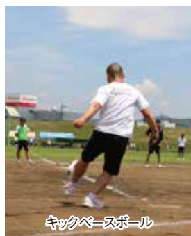
キックベースボール

5月25日、スポーツ日和の天候の中、新入生歓迎球技大会が開催されました。今年の球技大会は河川敷球場でキックベースを、体育館・マルベリー体育館の2会場でソフトバレーボールを行いました。各クラスで競技を選択し、男女別