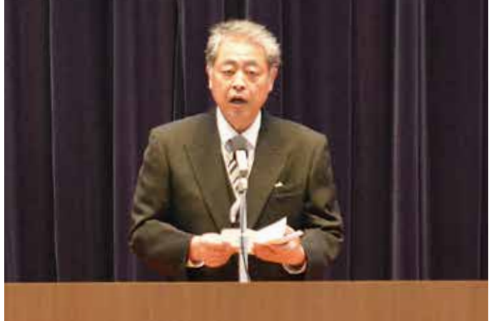
▲入学式での校長式辞