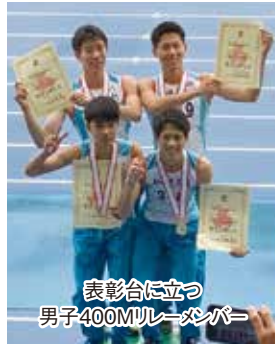
表彰合に立つ 男子400Mリレーメンバー

6月18〜21日、神奈川県川崎市等々力陸上競技場において関東高校総体陸上競技大会が行われました。男女25名が出場したこの大会は全国高校総体の出場権をかけた大会となります。