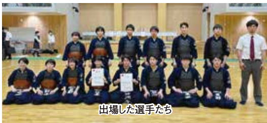
出場した選手たち

6月5・6日、埼玉県立武道館で関東大会が行われ、3年ぶりに男女揃っての出場を果たしました。初日の女子団体戦。初戦（シードの為2回戦）の