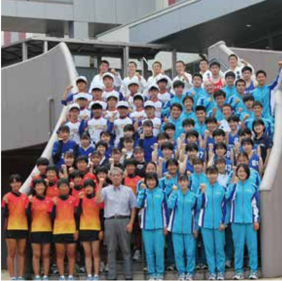
▲全国大会に出場した選手たち