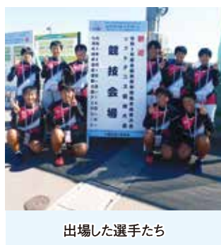
出場した選手たち