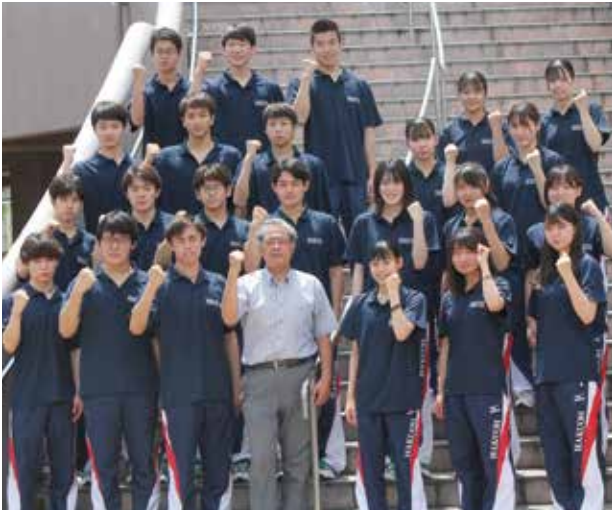
▼関東大会に出場した水泳部