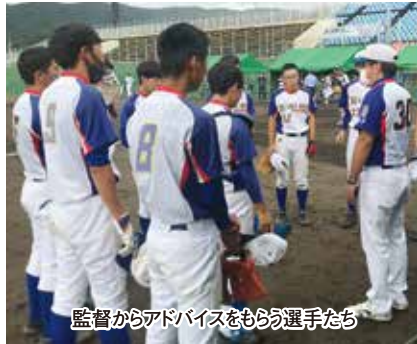
監督がアドバイスをもつ選手たち

8月3～6日、福井県敦賀市総合運動公園・敦賀市きらめきスタジアムにおいて全国高校総体ソフトボール競技大会が行われました。