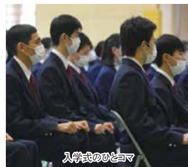
入学式のひとつコマ

次に、保護者の皆様もよくご存知の「PLUS ULTRA（プラスウルトラ）」という言葉についてです。この言葉は、上岡一嘉が白鷗大学第一回卒業式で卒業生に贈った言葉です。「PLUS ULTRA」を日本語に訳すと「さらに向こうへ」という意味になります。大航海時代にスペイン王国が世界進出を果たす際に、旗印として用いた言葉です。学校法人の建学の精神ともなっており、上岡一嘉の「従来の常識や既成概念にとらわれず、未知の世界へ挑戦する勇氣や情熱をもって前進し続けてほしい」という思いが込められています。