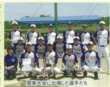
関東大会に出場した選手たち

6月6日、7日、神奈川県小田原市の酒匂川スポーツ広場ソフトボール場において第41回関東高等学校男子ソフトボール大会が行われました。今年度は部員が14名と