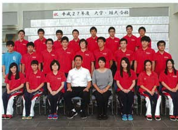
▲関東大会への出場を決めた水泳部員たち