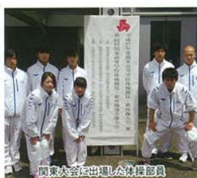
関東大会に出場した体操部員

これからも、安定性のある演技を目指し、日々鍛錬を怠ることなく部員一同精進していこうと思います。