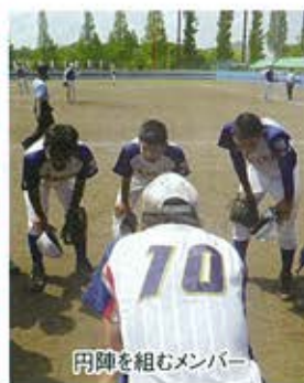
円陣を組むメンバー

8月8日、12日、滋賀県守山市の守山市民球場において全国高等学校総合体育大会ソフトボール競技大会が行われました。我がソフトボール部は全国大会での一勝を