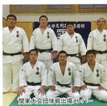
関東大会団体戦出場メンバー