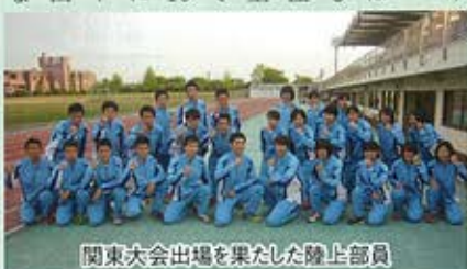
関東大会出場を果たした陸上部員

らが挑みました。今回は男女ともリレー種目が有望視されており、10年ぶりにインターハイ進出を狙いま