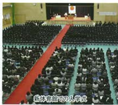
新体育館での入学式

生徒の皆さんには、これらの新しい施設を有効に活用して、学習活動や部活動・生徒会活動・委員会活動などに、これまで以上に積