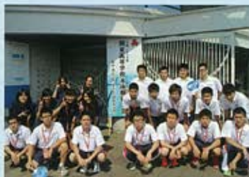
関東大会に出場した水泳部員

7月24日、26日、東京都の東京辰巳国際水泳場にて、第66回関東高等学校選手権水泳競技大会兼第83回日本高等学校選手権水泳競技大会関東地域予選会が開催されました。今大会で標準記録を突破すると、インターハイの出場権を得ることが出来ます。