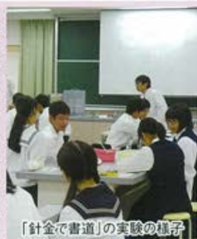
「針金で書道」の実験の様子

中学生を対象にした模擬授業では、本校舎、富田キャンパスそれぞれの特色ある講座が数多く設けられました。趣向を凝らした授業が展開され、中学生に楽しみな高校での学習活動の様子を知ってもらうことができました。