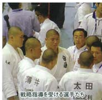
戦略指導を受ける選手たち

8月8日～12日にかけて、天理大学内第一体育館にて、第64回全国高等学校総合体育大会柔道競技大会が開催されました。本校からは団体戦で6名、個人戦で3名が出場しました。