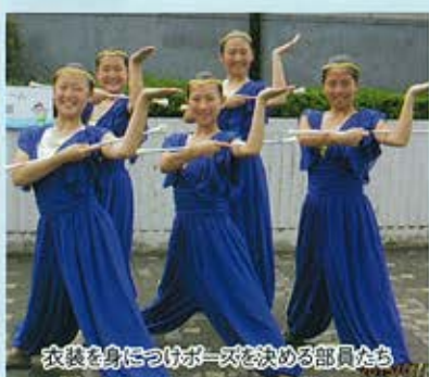
衣装を身につけポーズを決める部員たち

バントワリング部の2・3年生は、第39回全国高等学校総合文化祭（びわこ総文）に出場しました。7月28日、琵琶湖畔でのバントは雷雨のため中止になってしまいましたが、30日のバントワリング部門では、アラビヤ風の衣装に身を包んで、演技をしました。今年の演技タイトルは「一夜物語」。県内5校のバントワリング部で2月から毎月2回の