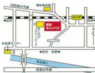
白鷺大学足利高等学校富田キャンパス