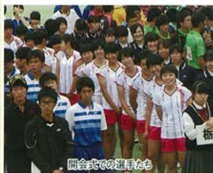
開会式での選手たち