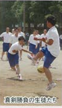
真剣勝負の生徒たち

5月26日、強い日差しの中、新入生歓迎球技大会が開催されました。今年度は、3月に完成した新