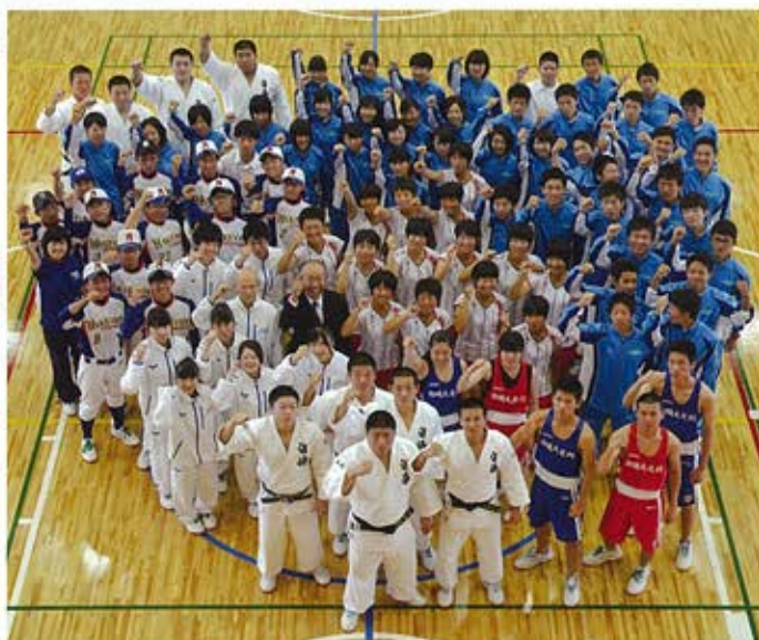
▼全国総合体育大会、全国大会への出場を決めた生徒たち