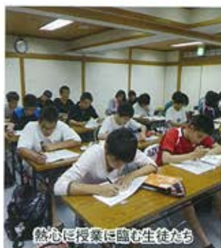
熱心に授業に臨む生徒たち

7月28日、30日、志賀高原ホテル一乃瀬にて、文理進学コースの学習合宿が実施されました。猛暑