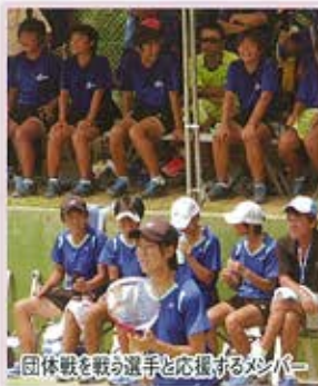
団体戦を戦う選手と応援するメンバー

団体戦の1回戦は太子高校（兵庫県）に3-0で勝利。2回戦の相手は昨年、選抜・インターハイ・国体で優勝を遂げた三重高校（三重県）。ポイントを取り合つて、三番勝負で0-3とされ、あとのない状況になりましたが、ここから粘って4-3で逆転しました。ベスト8を懸けた3回戦の相手は佐賀清和高校（佐賀県）。ここでも三番勝負を4-2で勝つて、初のベスト8入りを果たし、第5位入賞となりました。あと1点が取れずベスト8入りを逃した昨年の