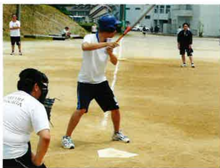
ソフトボールの様子