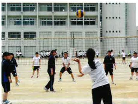
バレーボールの様子

技で優勝。サッカーは進学コース2年2組が健闘し、優勝候補と言われた進学コース3年4組を破り優勝しました。1年生も、新競技のバドミントンで特進コース1年1組が準優勝、ソフトテニスで進学コース1年3組が準優勝と健闘を見せ、来年度以降の活躍が期待できる結果となりました。暑い日となりましたが、熱中症で倒れる生徒もなく、充実した楽しい球技大会でした。